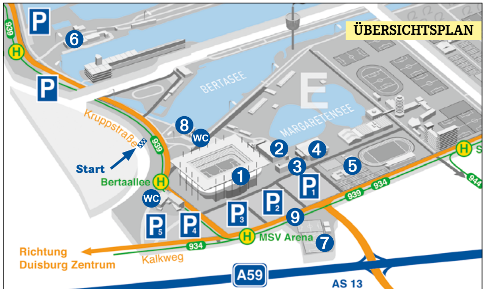
Lage der Wettkampfstätte / Map of the competition site / Plan des lieux de compétitionw