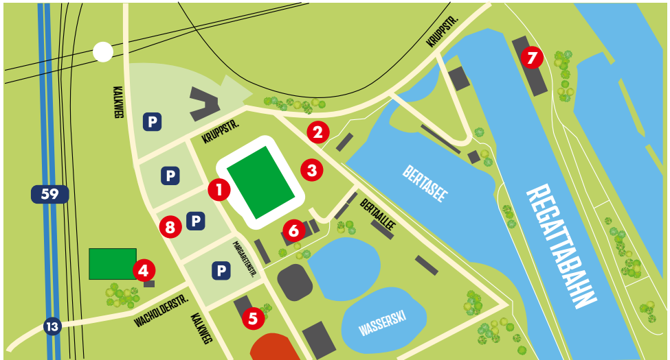
Lage der Wettkampfstätte/Map of the competition site/Plan des lieux de compétition